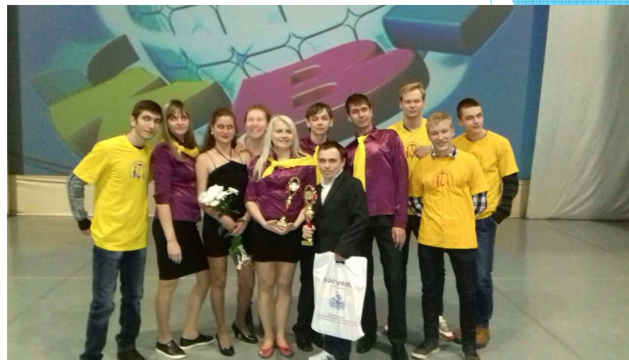
Студенты-волонтеры с командой КВН Пермского Края (призеры игр 2016 года)

Сопровождение волонтерской группой направления подготовки «Социальная работа» маломобильных категорий молодежи, участвующих в полуфинальной и финальной игре открытой лиги КВН ВОИ среди команд ЦФО РФ «Все как в кино». Обеспечение деятельности команд ВОИ из Воронежской, Ивановской, Ярославской области, Пермского края, а также Костромской команды «Сделано в Костроме». Результаты работы: победа Костромской команды КВН (1 место), 2017 (2 место). Добровольческая деятельность каждого студента-волонтера отмечена благодарственными письмами за оказание волонтерской помощи при проведении игры КВН ВОИ.