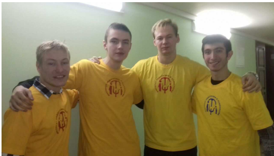
Участники волонтерской группы перед выступлением Костромской команды КВН